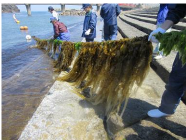
<マコンプ収穫実習>