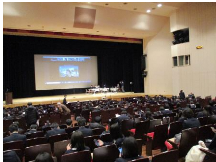
白嶺防災フォーラム